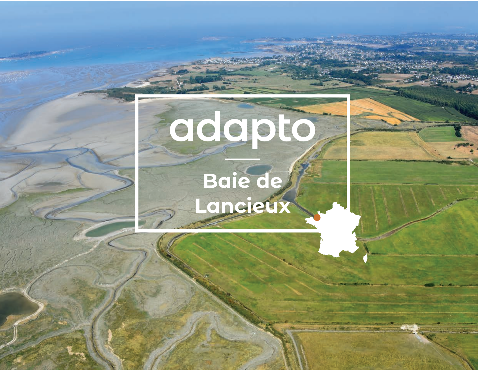
Baie de Lancieux à marée basse - 2016

Au Moyen-Âge, les moines bénédictins de l'Abbaye de Saint-Jacut ont édifié une digue, aujourd'hui appelée « digue aux Moines » pour gagner des terres cultivables sur les marais maritimes. Deux autres digues ont été construites par la suite. A l'abri derrière ces ouvrages, l'Homme a construit des routes et quelques habitations tout en créant des paysages naturels et agricoles d'une grande diversité.