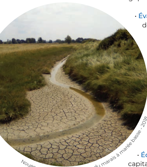
Nouvelles paysages à l'intérieur du marais à marée basse - 2018