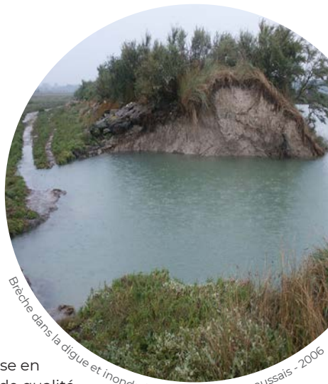
Bèche dans la digue et inondation du marais de Beaussais - 2006