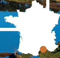
Vieux Salins d'Hyères - Étang et pinède de l'Anglais

Le site des Vieux Salins d'Hyères est le témoin de l'ancienne activité salicole qui a représenté un pilier du développement local de la rade d'Hyères, dans le Var, depuis le Moyen-âge. La lagune méditerranéenne naturelle, séparée de la mer par un cordon dunaire sableux, a été transformée par les hommes par creusements et endiguements pour créer le réseau d'étangs salins et de canaux encore existant aujourd'hui. A la fin de l'exploitation salicole, le Conservatoire du Littoral a acquis par expropriation en 2001 les 365 hectares des Vieux Salins pour en faire l'un des sites naturels protégés majeurs de la rade d'Hyères. Le sentier du littoral est très apprécié des promeneurs (environ 100 000 par an) qui peuvent profiter de paysages littoraux ombragés au niveau de la pinède de l'Anglais. Le plan de gestion en cours organise une gestion hydraulique du site proche de l'ancien fonctionnement des salins, dans un but d'optimisation de la qualité écologique et ornithologique. Bien qu'il soit relativement bien abrité