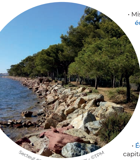
Secteur enroché avant travaux